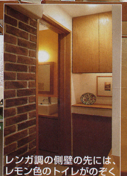
レンガ調の側壁の先には、 レモン色のトイレがのぞく