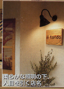
柔らかな照明の下、 入目を引く店名

shop data ●住所/東京都世田谷区松原3-41-9 ●TEL/03-3324-4830 ●FAX/03-6312-4663/ ●面積/14坪 ●席数/18席 ●11:30~14:30(L.O) 17:30~22:00(L.O) ●定休日/火曜日