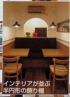
インテリアが並ぶ 半円形の飾り棚