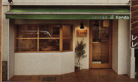
落ち着いた色調に緑色が映える外観

イタリアの明るい陽気な雰囲気を演出するため、こだわったのは配色でした。「オリーブの木々のようなグリーン」の入口が来店客を迎え、「レモンのような鮮やかなイエロー」が印象的なトイレの壁。個性の強い色を巧みに配すことで、オーナーからの要望でもあった「カジュアルで親しみやすい」店内となりました。床や入口正面のガラス面など、既存の部分を効果的に取り入れることにより、落ち着きある空間へと仕上げました。使う方にも来店客にも愛着の湧く、誰しもが気軽に入れるイタリア食堂がコンセプトとなっています。