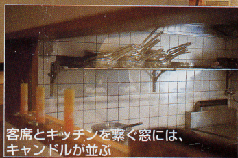
客席とキッチンを繋ぐ窓には、 キャンドルが並ぶ