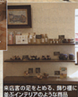
来店客の足をとめる、飾り棚に 並ぶインテリアのような商品