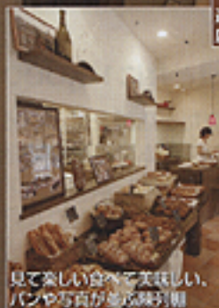
見て楽しい食卓で美味しい、 パンや写真が並ぶ陳列棚