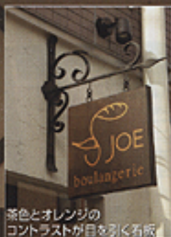
茶色とオレンジの コントラストが目玉の看板

shop data ●住所/東京都江戸川区南葛西2-23-10 ●TEL/03-5667-5490 ●面積/18坪 ●営業時間/8:00—売り切れ次第終了 ●定休日/月曜日 第1・3・5火曜日