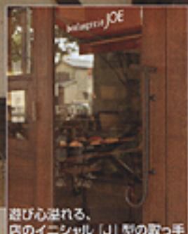
遊び心溢れる、 店のインシヤル「J」型の取っ手

「お客様との距離を近くしたい」というオーナーの要望は、ティンバーログの木目が親しみを、大きな窓が安心感を与えることで、実現しました。赤のオーニングが目玉の外観から一歩足を踏み入ると、横に大きく取られた陳列棚に多種多様なパンが並び、光景は見るも鮮やかです。厨房とフロアがガラス窓で繋がっており、働く方と来店客が言葉を交わさずとも親近感を生みます。目立つ場所だけでなく、ドアの取っ手や左官壁など、随所にこだわりと遊び心をのびせることにより、路面店としての存在感を際立たせ、毎日でも通いたくなるパン屋となりました。