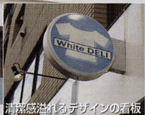
清潔感溢れるデザインの看板

shop data ●住所/東京都渋谷区宮ヶ谷2-20-1バルビゾン1F ●TEL/03-6661-4601 ●面積/9.17坪 ●営業時間/10:00~23:00 ●定休日/無し