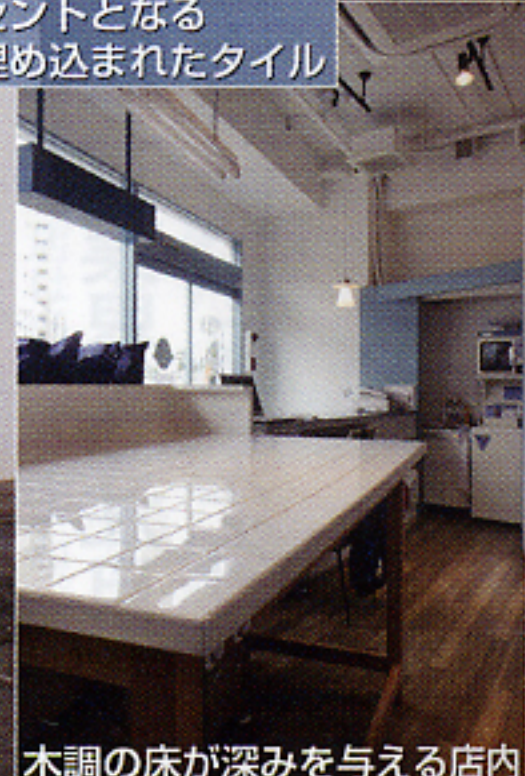
木調の床が深みを与える店内