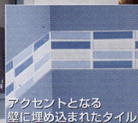
アクセントとなる壁に埋め込まれたタイル