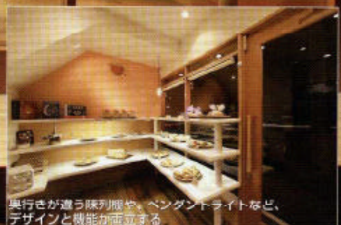
奥行きが違う陳列棚や、ペンダントライトなど、デザインと機能が両立する

店名である「デメテル」とは、ギリシャ神話における五穀豊穡の女神。パン屋にふさわしい店名に加えて、原材料である小麦のやわらかな色味を店全体に採用することで、首行く人にそこがパン屋であること知らせてくれます。オーナーの生まれ育った場所でもある商店街は、昭和30年代からの歴史があり、新規出店の際に周りの店舗との調和をはかれるよう、親しみの持てる存在感を演出しました。オーナーの思いをデザインへと転化させることで、どこか温かな印象が残る、愛着溢れるパン屋となりました。