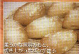
柔らかな照明のもと、焼き上がったパンが並ぶ

shop data ●住所/町田市鶴川2-14-13 セントラル商店街1F ●TEL/042-736-2238 ●面積/坪数/坪 2F・9坪 ●営業時間/10:00~18:00 ●定休日/日・月曜日