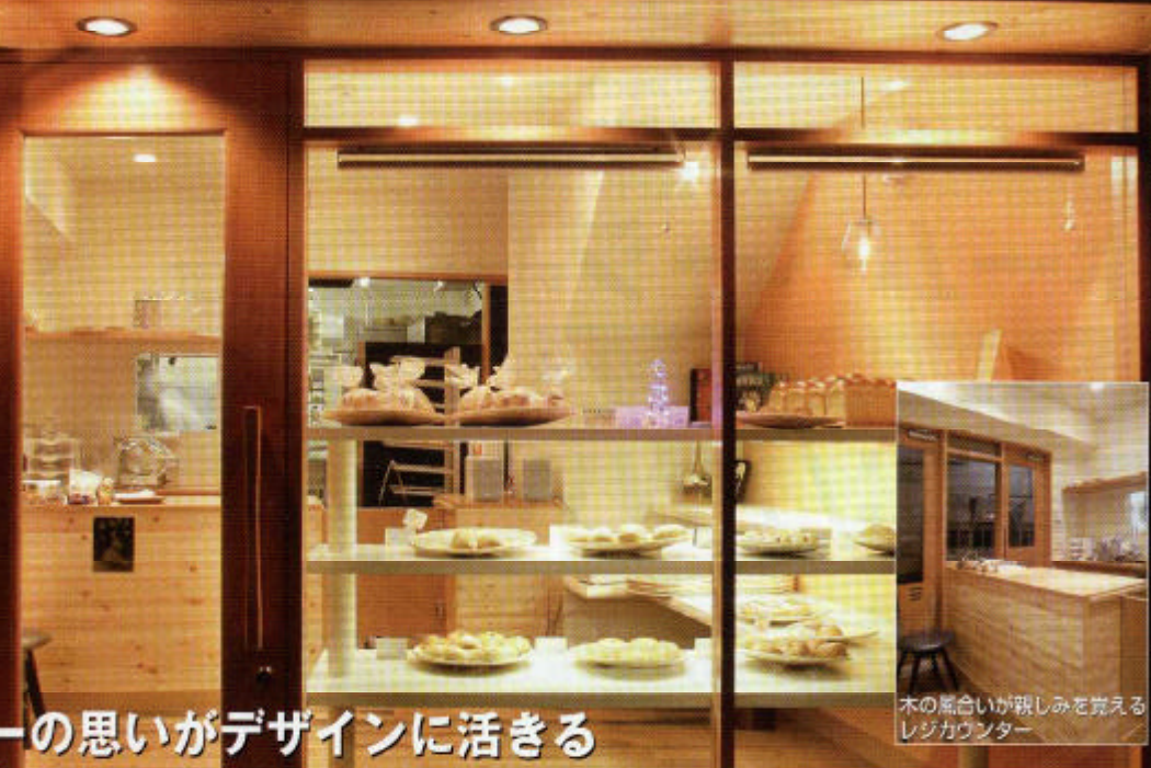
木の風合いが親しみを覚えるレジカウンター