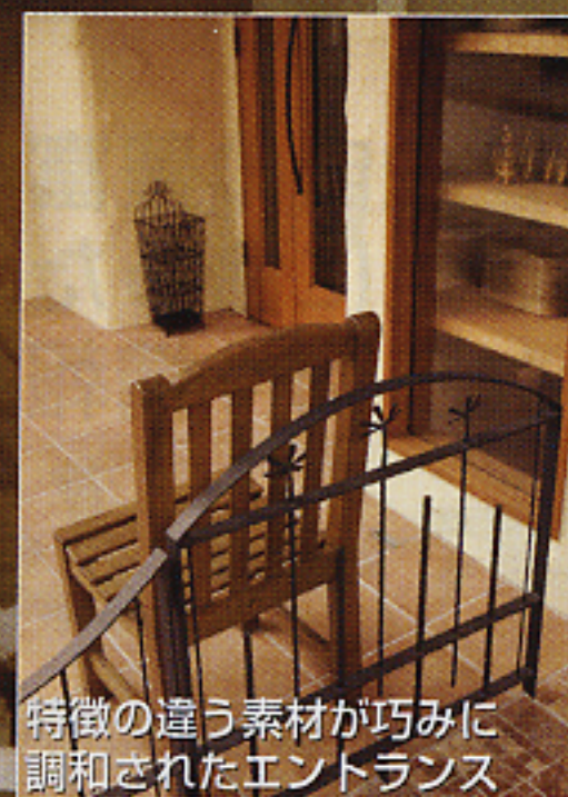
特徴の違う素材が巧みに調和されたエントランス