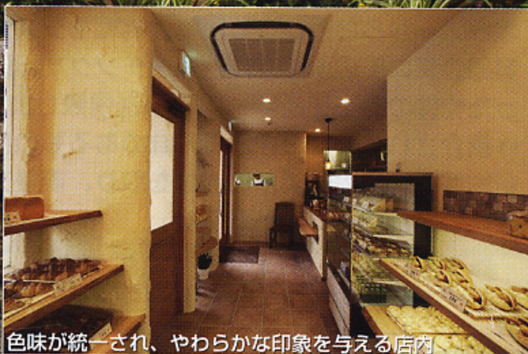
色味が統一され、やわらかな印象を与える店内

凹凸のあるオフホワイトの塗り壁に木の風合いを活かしたファサード。タイル張りされた床に鉄を使用した照明や取っ手。様々な素材を効果的に使用することで、やわらかな雰囲気醸すバランスのとれた店舗となりました。木の種類は場所によって使い分け、アイアンには素材感を出すため凹凸をつけるなど、細部にまでこだわった空間が客足を誘います。また、更衣室などバックヤードの充実やサンドウィッチルームの設置など、働く方の要望をデザインに取り込みました。機能性で働きやすい環境を整え、デザイン性で来店客を楽しませる。飽きのこない、愛着溢れるお店となりました。