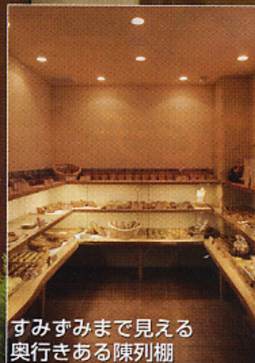
すみすみまで見える奥行きある陳列棚